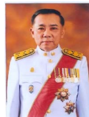
พลตำรวจเอก เอก อังสนานนท์ กรรมการธิการ