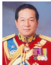
พลเอก อรุณ สมตน กรรมการธิการ